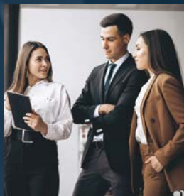
Servizi di consulenza